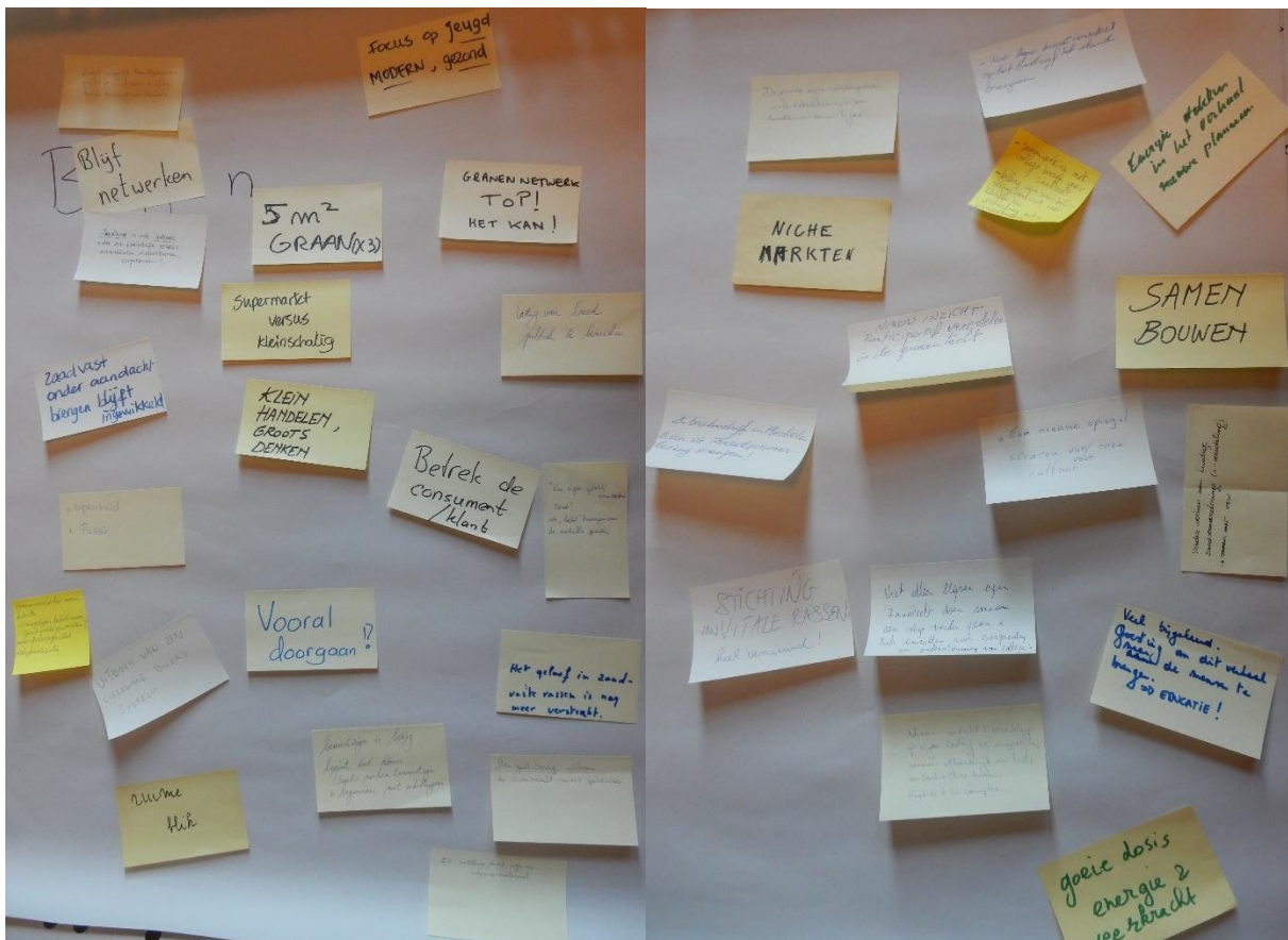
Verslag door Greet Lambrecht

Hartelijk dank voor jullie aanwezigheid en vruchtbare bijdragen!